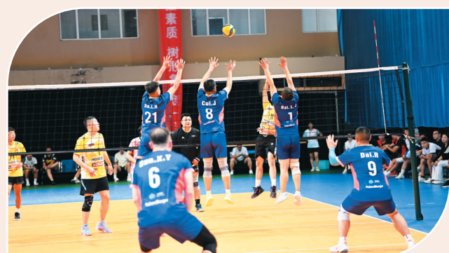
职工运动会增强了职工凝聚力