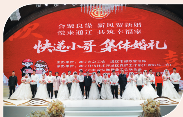
快递小哥集体婚礼活动

榜样的力量是无穷的。2025年,全市74名劳动者获评全国、自治区劳动模范和先进工作者,3名优秀工匠被培育为“北疆工匠”。承办全区劳模事迹巡回宣讲报告会,深入开展劳模工匠精神进企业、进校园、进机关宣讲和“劳模工匠助企行”等活动。在通辽职业学院报告厅,全国劳模讲述自己从一名普通焊工成长为技术能手的奋斗历程,台下数百名学生眼中闪烁着崇敬与向往。“劳动光荣、创造伟大”不再是抽象的口号,而是一个个可触可感的身边榜样。