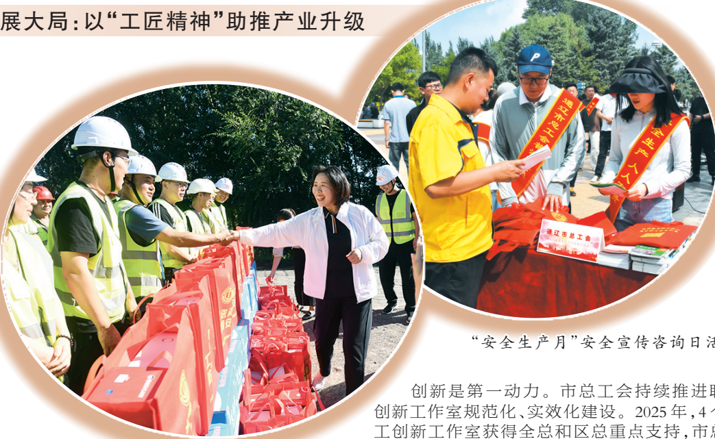
“安全生产月”安全宣传咨询日活动

劳动和技能竞赛是职工成长成才的“快车道”。2025年,承办全区引领性劳动和技能竞赛项目2个、自治区职工职业技能竞赛1个,联合30余家单位开展“十大行业”22个工种的职工职业技能竞赛。从建筑工地到制造车间,从电力检修到医疗护理,一场场技能比武如火如荼。据统计,全年组织2812家建会企事业单位、25.2万余名职工参与劳动和技能竞赛活动,1622名职工通过竞赛实现技术等级提升。“通过参加竞赛,我不仅拿到了高级资格证,还找到了技术