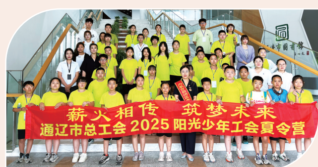
薪火相传·筑梦未来——通辽市总工会2025年夏令营活动