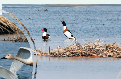
▲翘鼻麻鸭羽毛鲜亮,姿态从容。