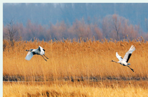
▲丹顶鹤舒展羽翼,身姿灵动。