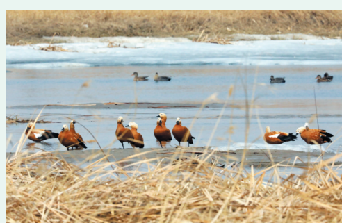
▲赤麻鸭静立于浅滩。