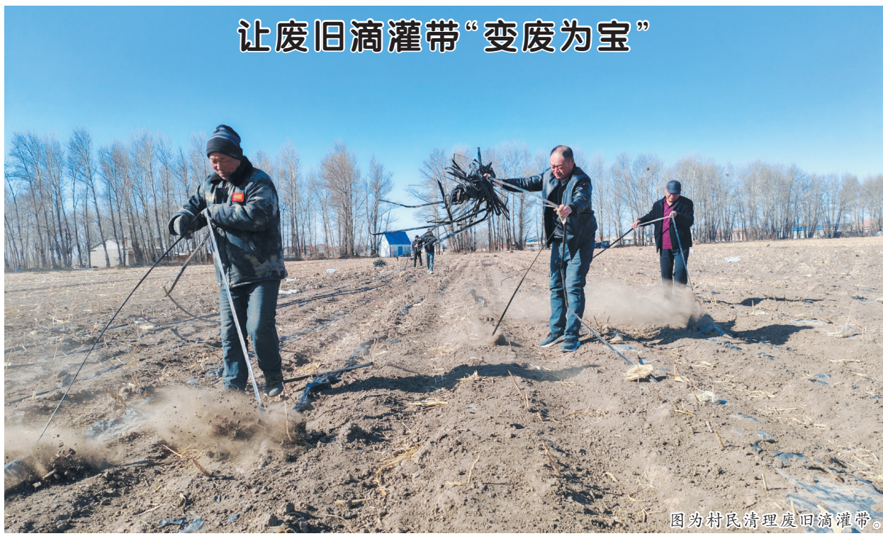
图为村民清理废旧滴灌带。