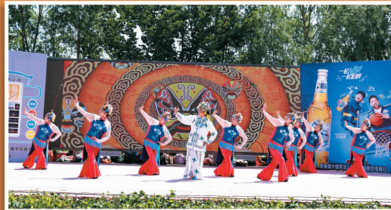
庙会消夏活动现场,村民自编自演舞蹈展风采。

沿科尔沁500公里风景大道向燕山余脉的八虎山前行,山脚下的四一村尽显山水灵秀之气。作为通辽市少有的山、水、林、田、路、草自然资源集中区域,这里错落分布的乡村书屋、干净整洁的环湖步道,以及夜晚唯美梦幻的水幕灯光秀,勾勒出宜居宜游的乡村新风貌。坐落于此的八虎山庄,将“乡韵”与“生态”融合到极致——林木繁茂、山水秀丽,质朴的建筑风格与浓郁民俗风情相互映衬,原生态风光被完好保存。山庄巧妙串联青龙山