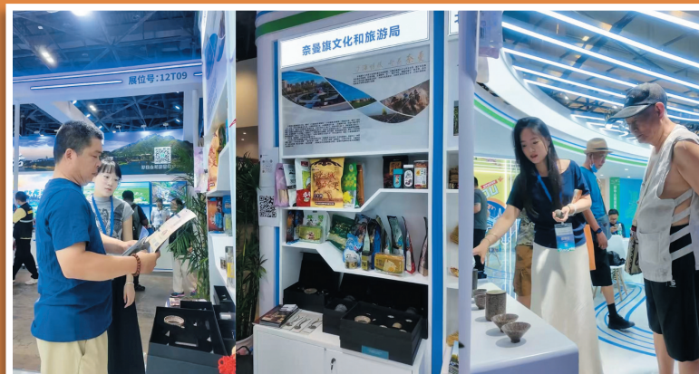
奈曼特色旅游商品惊艳亮相北京国际文旅消费博览会。

洼风景区、陈国公主墓、龙尾沟风景区,打造“四点三线两风格”的精品旅游线路,成为奈曼南部绿色生态旅游的核心枢纽。