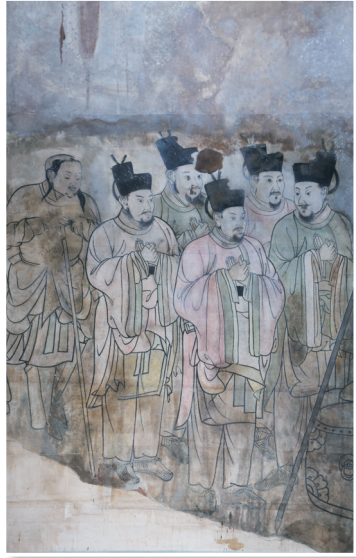
库伦辽墓壁画(局部)。

情鲜活、骏马造型逼真,场面宏大,人物比例与真人相近。既融汇了唐宋绘画传统,又保留了鲜明的契丹文化特征,具有极高的艺术与历史价值,也是学术界研究辽代历史文化的重要对象。