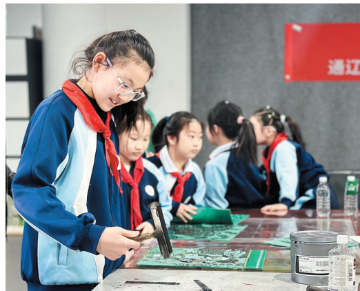
化身小工匠,感受版画艺术的魅力。

春风和煦,美育启航,为了让美的种子在少年儿童心中生根发芽,近日,通辽市第一小学的学生们走进通辽市美术馆,开启“新学期美育第一课”,在沉浸式艺术体验中探寻美、感受美、创造美,让温润美育滋养纯真童心。