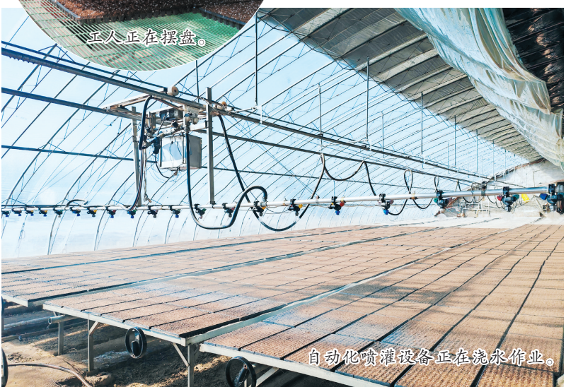
自动化喷淋设备正在浇水作业。

人勤春来早，育苗正当时。作为“中国红干椒之都”，开鲁县红干椒年均种植面积达60万亩，辣椒产业已成为当地群众增收致富的主导产业。眼下，全县各地抢抓农时，科技育苗、工厂化育苗全面铺开，田间地头一派繁忙景象。