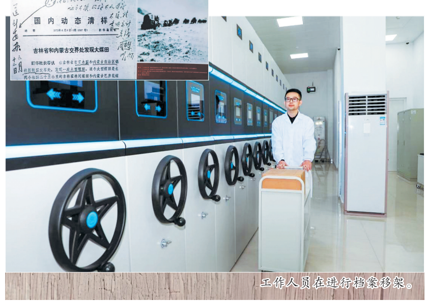
工作人员在进行档案移架。