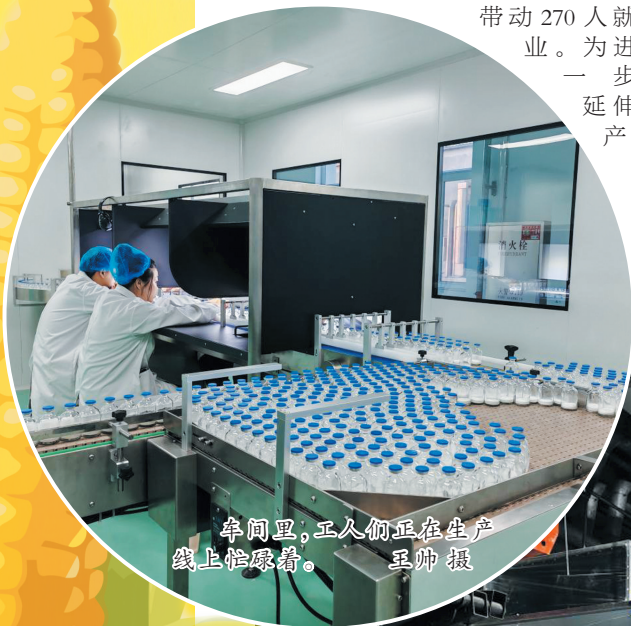
车间里,工人们正在生产线上忙碌着。

“坚持做大做强玉米深加工产业目标,园区集聚了玉米生物、医药化工企业34家,年转化加工玉米200万吨左右,创造价值70亿元,占园区总产值70%,已经成为推进全县经济社会发展的强劲动力。”通辽开鲁生物医药开发区经济发展与金融事务局局长高艳明满怀信心地说。