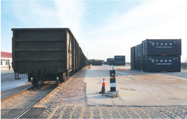
整装待发的货车。

隆冬时节的通辽市通兴粮油贸易有限公司东来库,叉车、运粮车有序穿梭,传输带将运粮车里的玉米粒送进集装箱,正面吊举起粗壮的“手臂”,将满载玉米的集装箱稳稳当当停放在货车车厢,长长的货车静静地停在轨道上,等待发车南下。