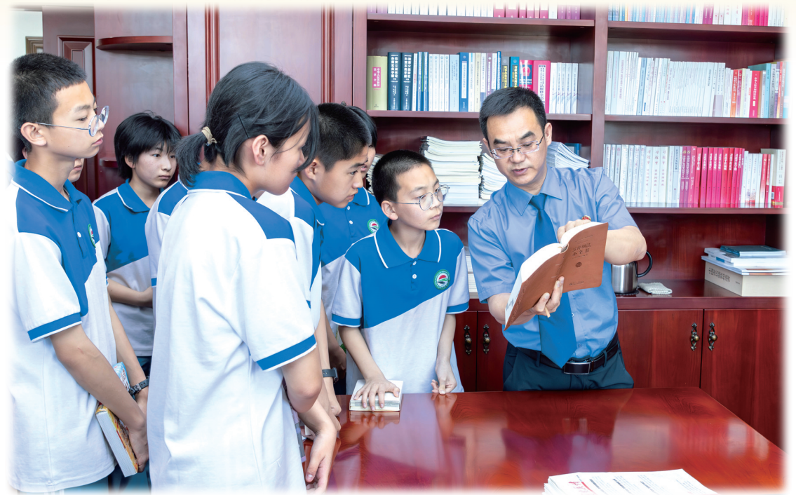
通辽市检察院以“携手关爱,共护未来”为主题举办检察开放日活动暨中学生法治实践教育活动。