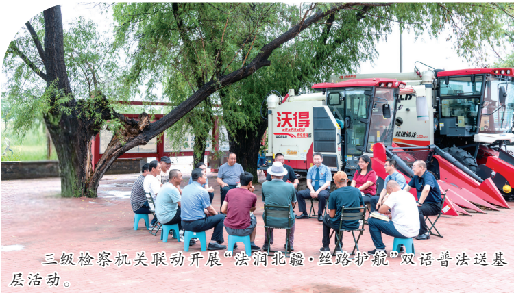
三级检察机关联动开展“法润北疆·丝路护航”双语普法送基层活动。

2025年以来,通辽市检察机关以“新时代法律监督助力高质量发展”为主线,推动府检同频共振、协同发力,实现监督与支持并重,依法行政与公正司法互补,奏响了统筹安全与发展、融合法治与温情的善治乐章。