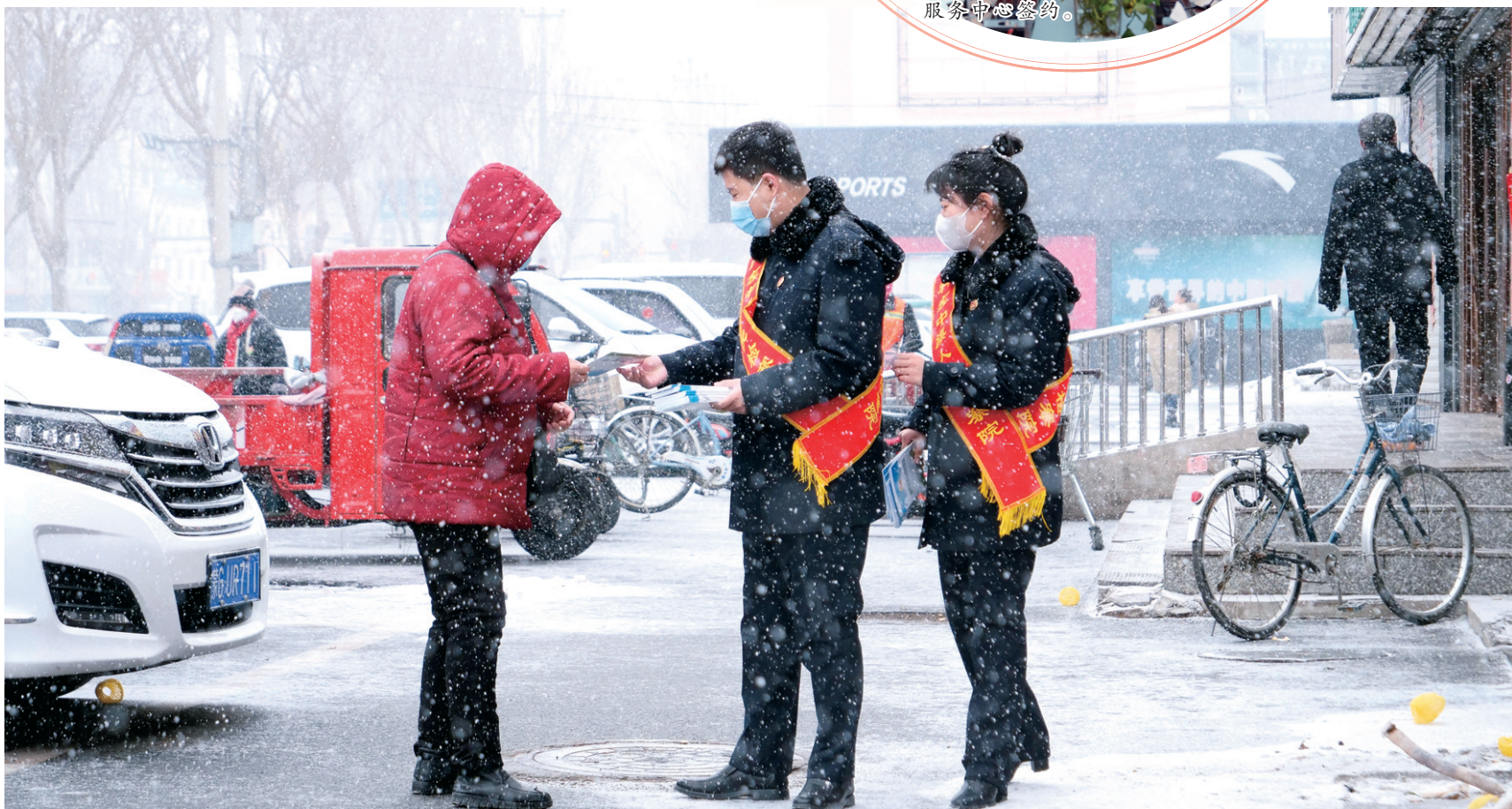
科左中旗检察院“益”护达尔罕公益法律顾问团开展防范养老诈骗宣传活动。

与此同时,生态环境保护协同治理,正在向更广范围、更深层次拓展。聚焦西辽河流域生态保护,市检察院监督助力某政府对境内东西辽河14座简易浮桥修缮改造,保障西辽河全线过流行洪安全和当地村民过河出行安全。与林草、自然资源等部门开展草原保护、沙地治理等专项监督,办理生态环境公益诉讼案件299件,监督修复山林、河湖、草原20余万亩。深化落实“专业化监督+恢复性司法”模式,让净水长流、蓝天常在。