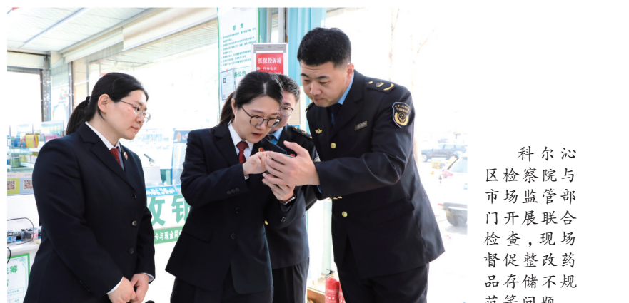
科尔沁区检察院与市场监管部门联合开展联合检查,现场督促整改药品存储不规范等问题。