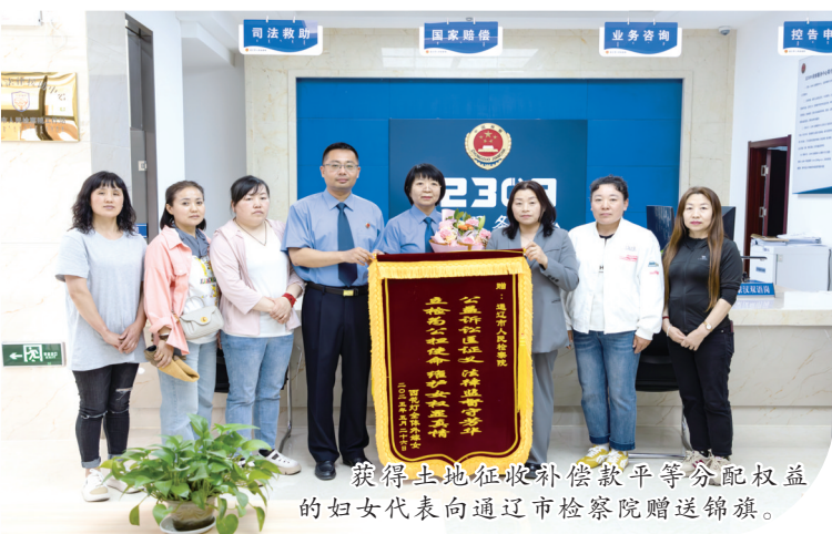
获得土地征收补偿款平等分配权益的妇女代表向通辽市检察院赠送锦旗。