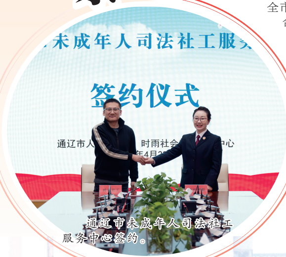
通辽市未成年人司法社工服务中心签约仪式。

立足新的发展起点,通辽以“府检联动”为基石,正在垒筑一座法治护航高质量发展的坚实大厦。法治对于这座城市而言,不是冰冷的法律条文,而是看得见、摸得着的公平正义,是百姓安居乐业、共享发展成果的坚强保障。