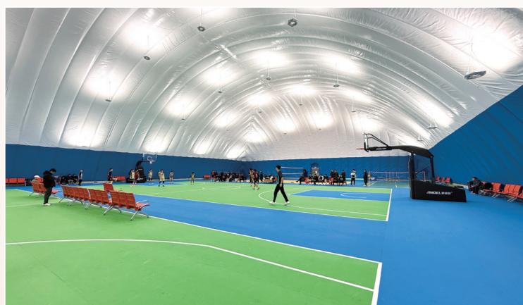
科尔沁艺术职业学院文体综合馆