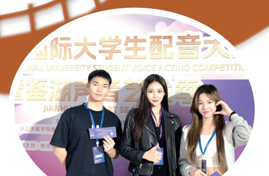
科尔沁艺术职业学院学子荣获第六届国际大学生配音大赛影视组全国二等奖