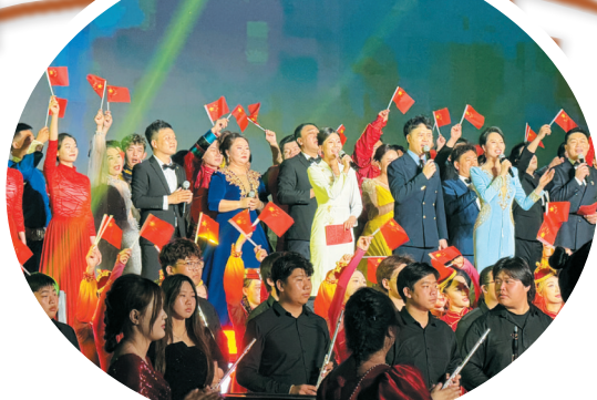
科尔沁艺术职业学院庆“七一”文化惠民展演