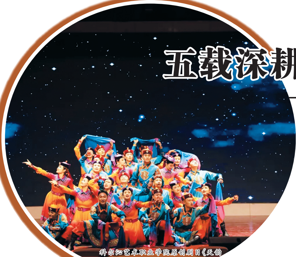
科尔沁艺术职业学院原创剧目《昆韵·昆曲》荣获CEFA首届“芳华无限”舞蹈类原创作品创作技能竞赛二等奖

当“十四五”的壮阔画卷在神州大地徐徐铺展，时代浪潮奔涌向前，科尔沁草原的深处，一颗艺术教育的明珠正沐浴时代光华，熠熠生辉。五度寒暑，五载耕耘，科尔沁艺术职业学院以其深沉的艺术血脉与鲜明的文化担当，迎来了历史性的发展机遇。