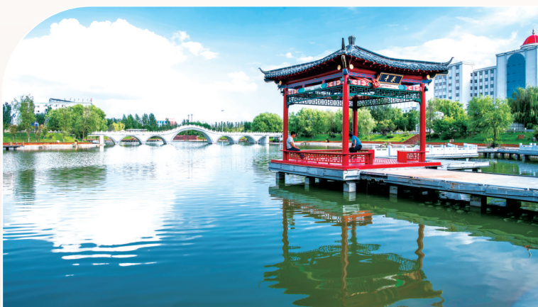
科尔沁艺术职业学院校园环境

从草原深处走来，向广阔天地走去。科尔沁艺术职业学院这所草原艺术教育的摇篮，正以更加自信的姿态，更加坚定的步伐，朝着建设特色鲜明的高水平艺术职业学院目标迈进，为服务教育强国、教育强国、教育强市建设贡献力量。