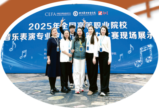
科尔沁艺术职业学院钢琴教学团队荣获2025年全国高等职业院校音乐表演专业教师教学能力比赛三等奖

五年，是标尺，丈量着跋涉的跨度；五年，更是诗行，铭刻着创新的韵律与梦想的高度。站在“十四五”收官与新一轮规划启航的交汇点上，回望来路，科尔沁艺术职业学院人以教育为笔，以艺术为墨，绘就了高质量发展的崭新图景：从党建领航把稳方向，到专业建设淬炼内核；从师生赛场竞逐风流，到校园焕新筑梦家园……每一步前行，都回响着高质量发展的铿锵足音；每一份硕果，都凝结着对艺术职业教育未来的深切期许。此刻，让我们循着时光的脉络，走进科尔沁艺术职业学院这五年不凡的征程，聆听一曲草原艺术教育摇篮的奋进长歌。