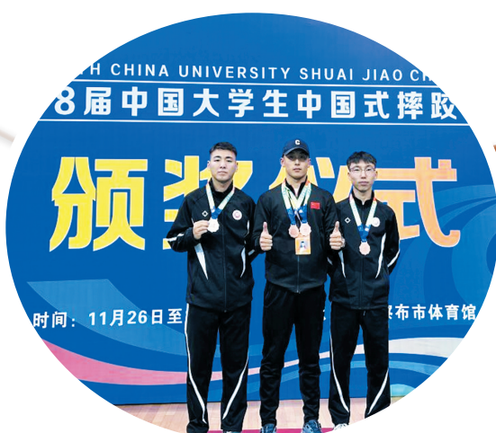
科尔沁艺术职业学院学子在全国大学生中国式摔跤锦标赛中喜获双铜