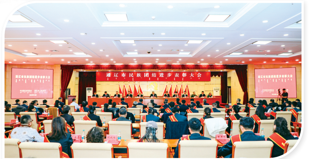
通辽市民族团结进步表彰大会现场

“问渠那得清如许，为有源头活水来。”理论研究的深化是民族团结进步事业行稳致远的源头动力，通辽市始终将铸牢中华民族共同体意识理论研究作为基础性工程，以“西辽河文化”为核心抓手，不断擦亮这张阐释中华民族多元一体格局的“金色名片”。 “十四五”期间，通辽市实施《西辽河文明研究五年行动计划》，与中国社科院、内蒙古大学、内蒙古民族大学等科研院所深度合作，建设铸牢中华民族共同体意识研究通辽基地，组建西辽河流域文明研究专家工作站和史前遗址博物馆联盟，制定专家库、研究项目管理办法，推动理论研究科学化发展。深入开展“中华文明探源工程”通辽行动，参与《中华民族交往交流交融史料汇编·内蒙古卷》编纂，完成《铸牢中华民族共同体意识视域下通辽市“融城”建设实践研究》等课题研究，形成20余篇阶段性论文。与内蒙古大学开展的《内蒙古通辽市推进中华民族共同体建设的经验与启示研究》项目，全面研究总结通辽地区铸牢中华民族共同体意识的典型经验与做法，形成了20万字重要理论研究成果，扎实印证了5000多年来各民族