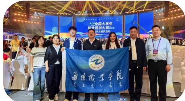
通辽职业学院学子荣获大学生职业规划大赛国赛金奖和铜奖。

地167个。新校区搬迁后，在原有基础之上，推动9个教学系生产性产教融合实训室的建设。坚持以赛促教、以赛促学，近三年承办自治区级以上赛事近10项，师生荣获国家级奖项70余项、自治区级奖项470余项。