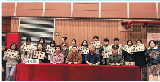
《马走日》剧组和观众互动。

的坚实纽带,不仅让红色基因在跨地域传播中赓续绵延,更以鲜活的戏剧动能,为铸牢中华民族共同体意识注入了深沉而持久的文化力量。它既承载着通辽文艺工作者对红色历史的敬畏与传承,更彰显着这座城市以文化之力凝聚人心、联结山海的使命担当。