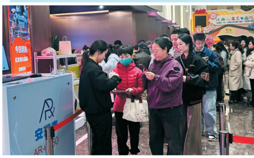
在江西南昌红谷滩大剧场,观众入场准备观看《马走日》。王议铭摄