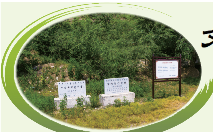
富河文化遗址 (2022年6月30日 摄于赤峰市巴林左旗富河镇富河沟门村)