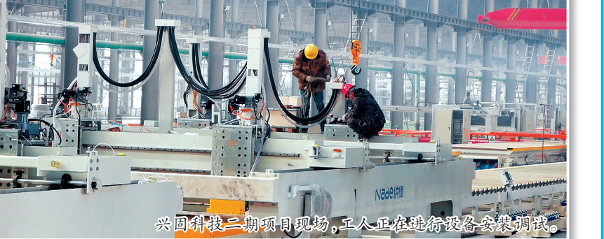
兴固科技二期项目现场,工人正在进行设备安装调试。

在内蒙古兴固科技有限公司东方晶硅新材料一期项目厂房内,随着UV打印技术的精准运转,一批色彩鲜明、色系丰富的奢石产品接连下线。作为我市新材料产业的核心企业,手握24项专利技术的兴固科技,年产东方晶硅新材料600万平方米,产值约5亿元,为当地提供了500个就业岗位。目前,企业二期项目正抢抓工期加快推进,其创新采用国内首创的“一窑两线”工艺,可高效“吃干榨净”本地风积沙、石灰石等资源,稳定生产3毫米至35毫米全厚度的东方晶硅新材料。