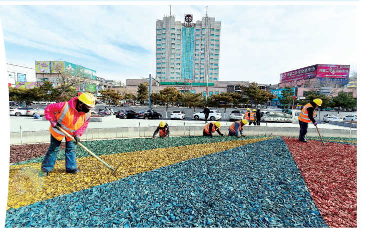
工人们打理景观带。(和平路双拥广场)