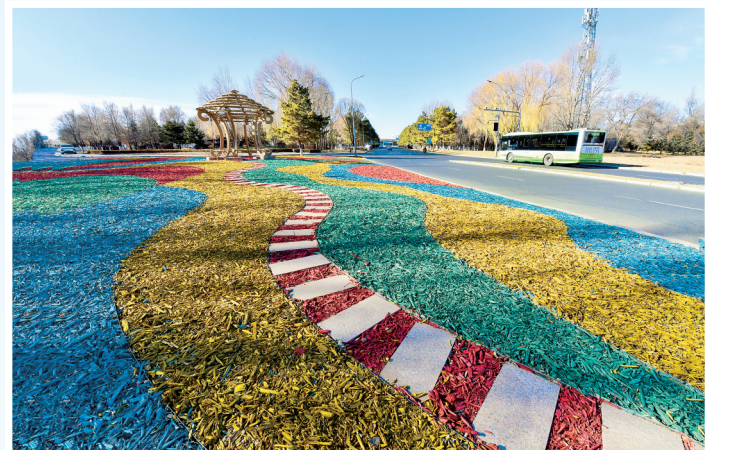
五彩景观装扮游园。(通辽机场)