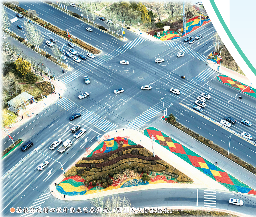
枯枝经过精心设计变成艺术精品。(哲里木大桥北桥头)