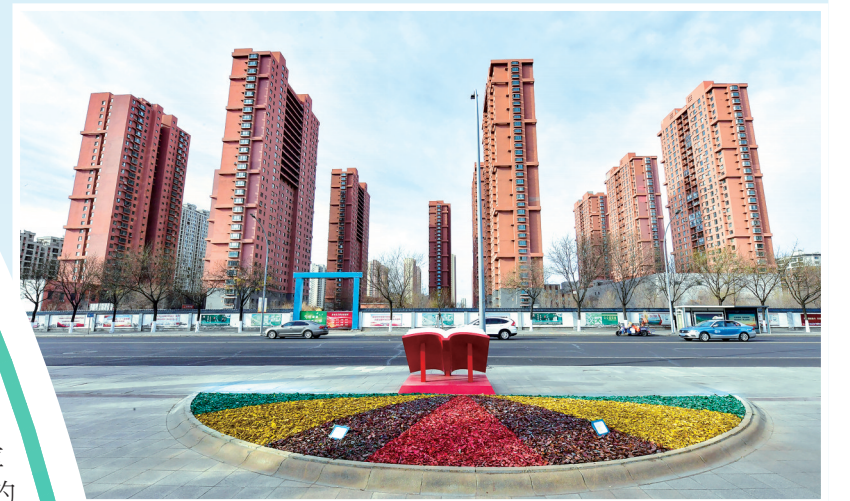
小区出门即美景。(市民公园)

夕阳西下，市民广场的“五彩毯”在余晖中泛着柔和光泽。散步健身的老人、奔跑嬉戏的孩童，在这片冬日限定景观中流连。这场“城市换装”，正悄然改变着城市生态治理的方式，让城市的冬天在色彩与生态的交融中焕发新生。