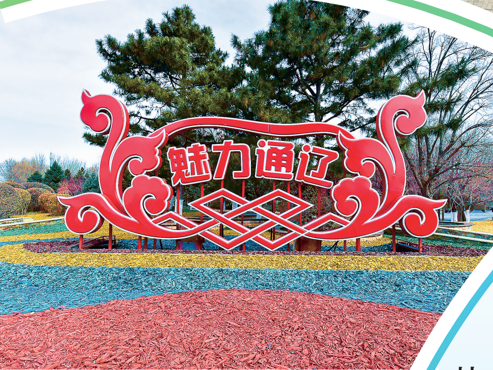
松柏与彩色图案相映成趣。(哲里木大桥南桥头)