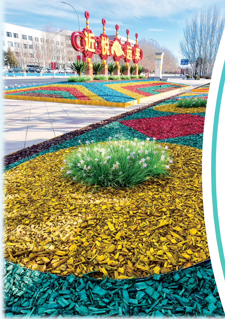
充满艺术感的休闲空间。(市民广场)