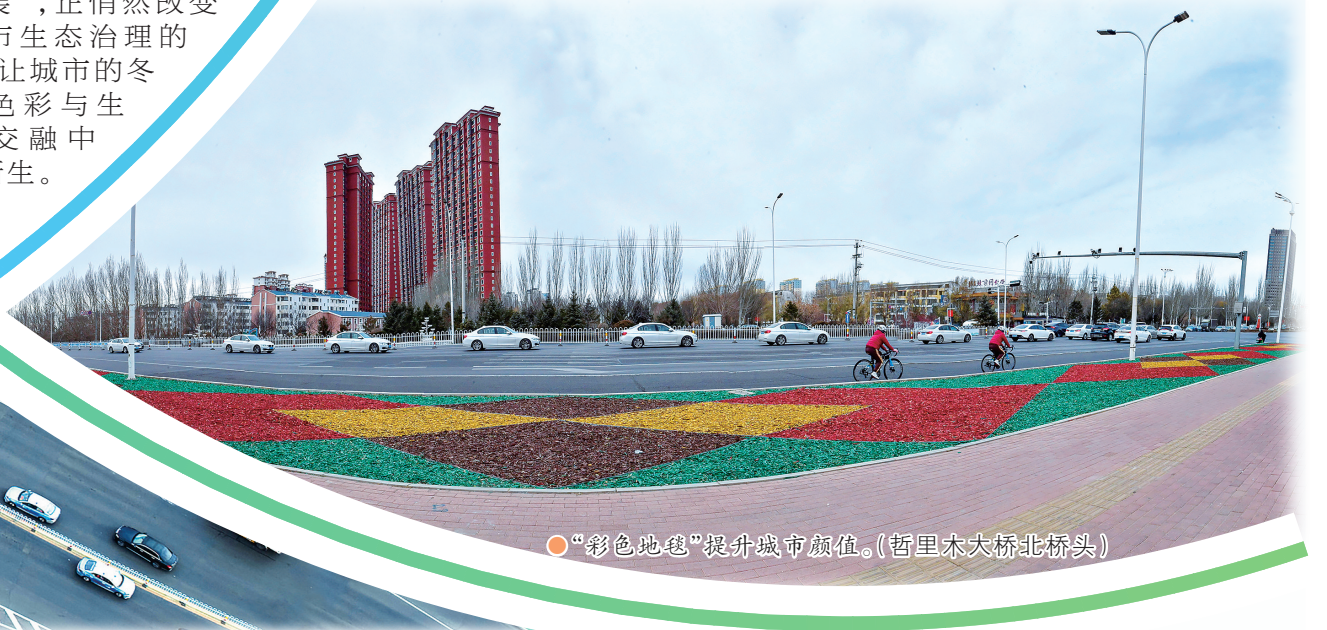
“彩色地毯”提升城市颜值。(哲里木大桥北桥头)