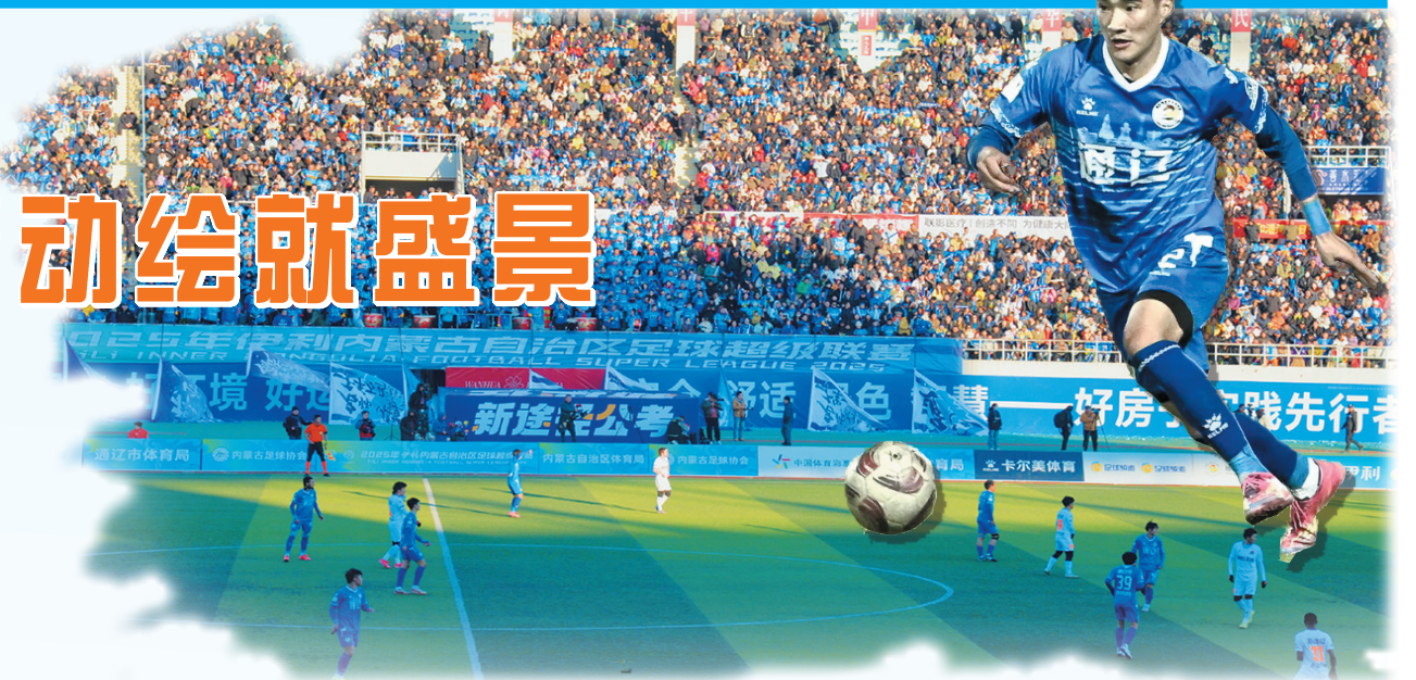
“草原足球嘉年华”,完美诠释豪气魅力。

悦来河旅游休闲街区作为我市文旅新地标,勾勒出“城市客厅”的轮廓。该街区以“科技+人文+美食”为核心,打造沉浸式体验矩阵:“悟空82难”“嫦娥奔月”等高空威亚神话剧每日上演,汉服巡游与“玉兔