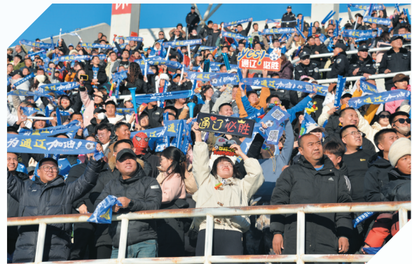
蒙超联赛点燃通辽球迷热情。