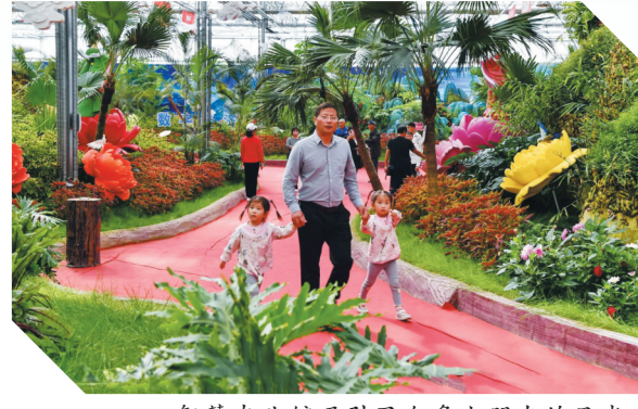
智慧农业馆吸引了众多小朋友的目光。