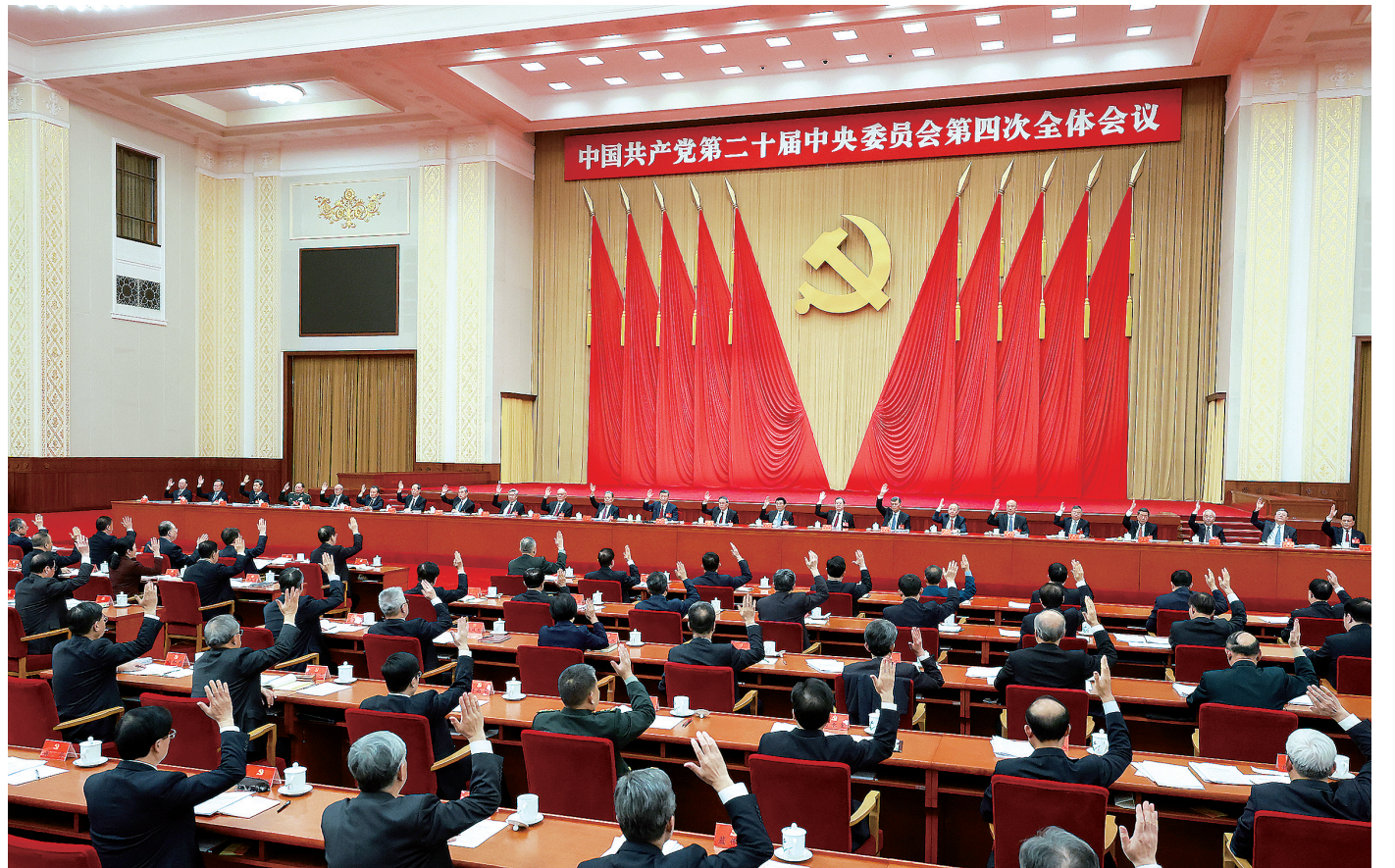
中国共产党第二十届中央委员会第四次全体会议,于2025年10月20日至23日在北京举行。中央委员会总书记习近平作重要讲话。