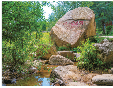
光头山脚下的辽河源头，此地已辟为辽河源国家森林公园。（2022年8月25日摄于平泉市柳溪镇辽河源国家森林公园）

老哈河是西辽河干流的南源。从秦汉至魏晋称“乌候秦水”，《魏书》有“乌候秦水，广袤数百里，