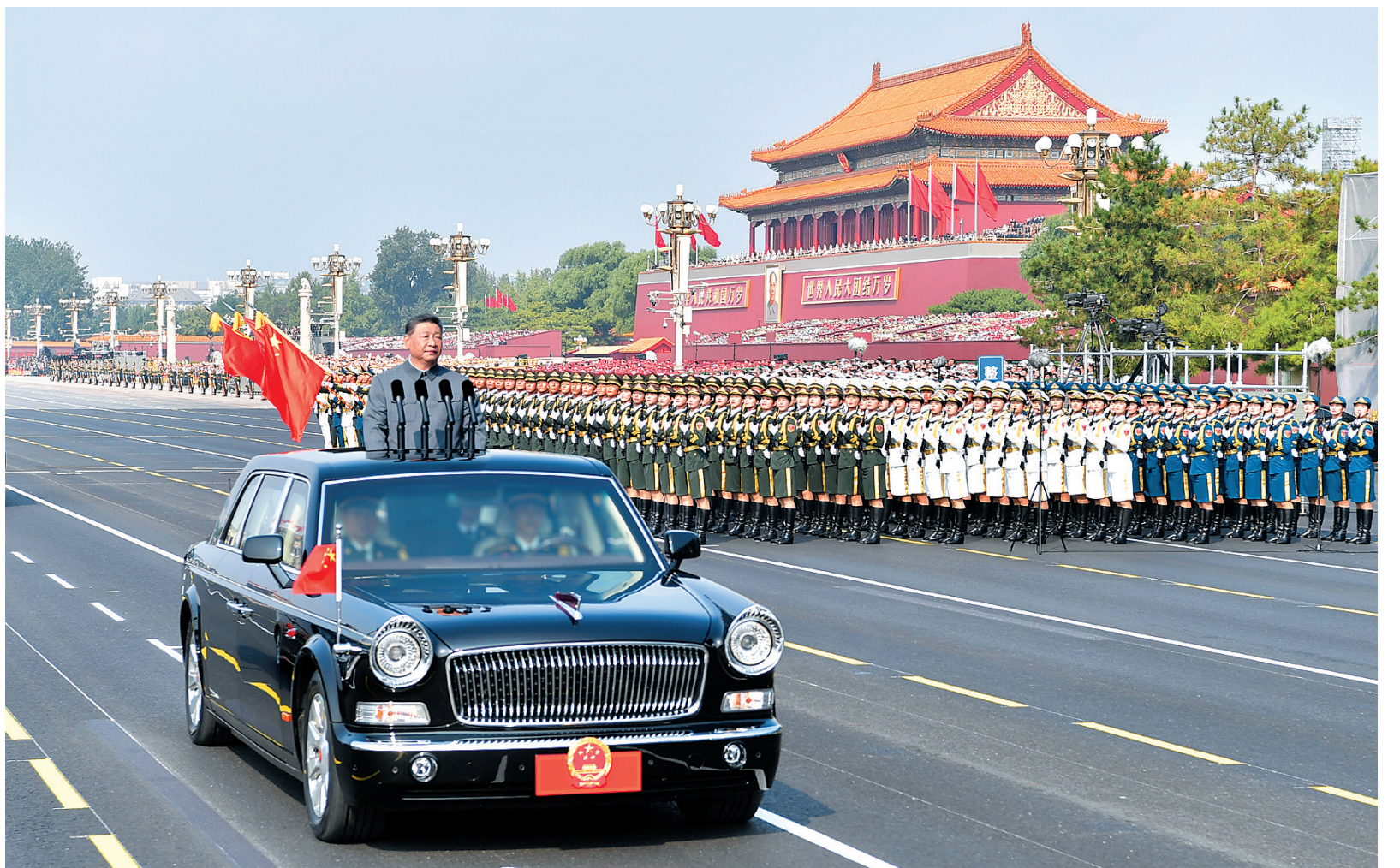
9月3日,纪念中国人民抗日战争暨世界反法西斯战争胜利80周年大会在北京天安门广场隆重举行。这是中共中央总书记、国家主席、中央军委主席习近平检阅受阅部队。

新华社北京9月3日电 铭记伟大历史胜利,凝聚正义和平力量。9月3日上午,纪念中国人民抗日战争暨世界反法西斯战争胜利80周年大会在北京天安门广场隆重举行,以盛大阅兵仪式,同世界人民一道纪念这个伟大的日子,共同开创更加光明的未来。中共中央总书记、国家主席、中央军委主席习近平发表重要讲话并检阅受阅部队。