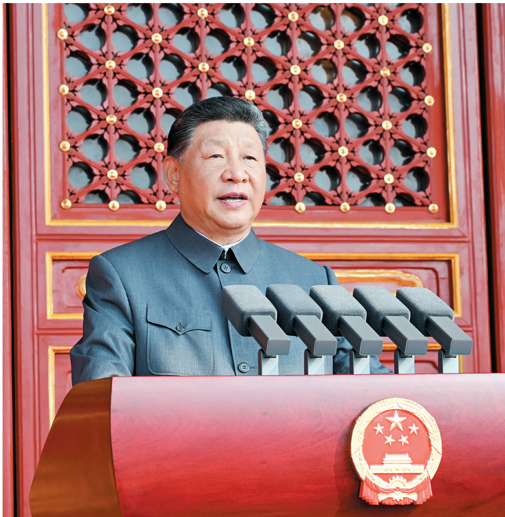
9月3日,纪念中国人民抗日战争暨世界反法西斯战争胜利80周年大会在北京天安门广场隆重举行。中共中央总书记、国家主席、中央军委主席习近平发表重要讲话。

李强主持 赵乐际王沪宁蔡奇丁薛祥李希韩正出席 61位外国领导人及有关国家高级别代表、国际组织负责人、前政要等应邀出席大会