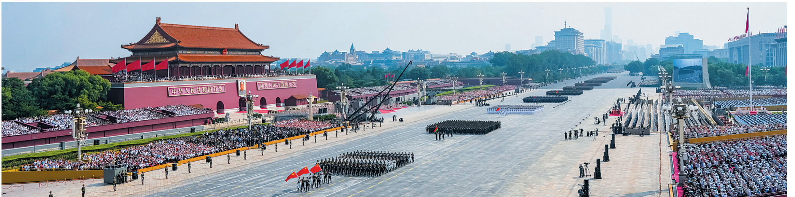
9月3日,纪念中国人民抗日战争暨世界反法西斯战争胜利80周年大会在北京隆重举行。这是徒步方队接受检阅。