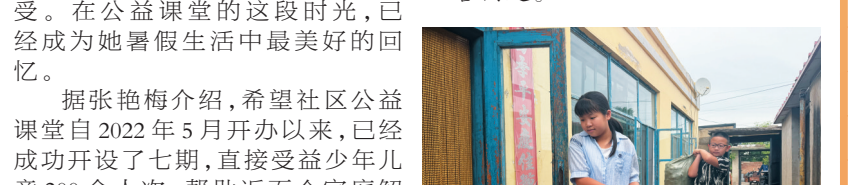
孩子们将捡拾的松塔送到行动不便老人家中。

“放暑假的时候,我在社区居民群里看到招募志愿者的信息就报名参加。” “探索大自然。”