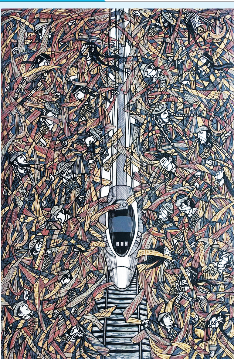
科尔沁新龙 宝·乌兰巴拉 作

以上就是我这个半吊子滑手对滑板的一点感悟。我还会接着滑滑板,接着死磕一个动作,直到彻底磕下来。我会永远保持年轻的心态,永远从生活中找寻快乐。