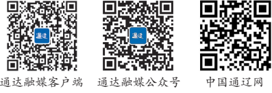
通辽融媒客户端 通辽融媒公众号 中国通辽网