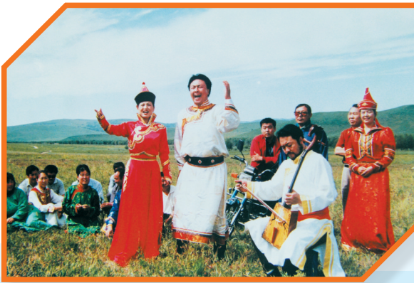
2004年8月,市乌兰牧骑队员为农牧民表演科尔沁民歌。