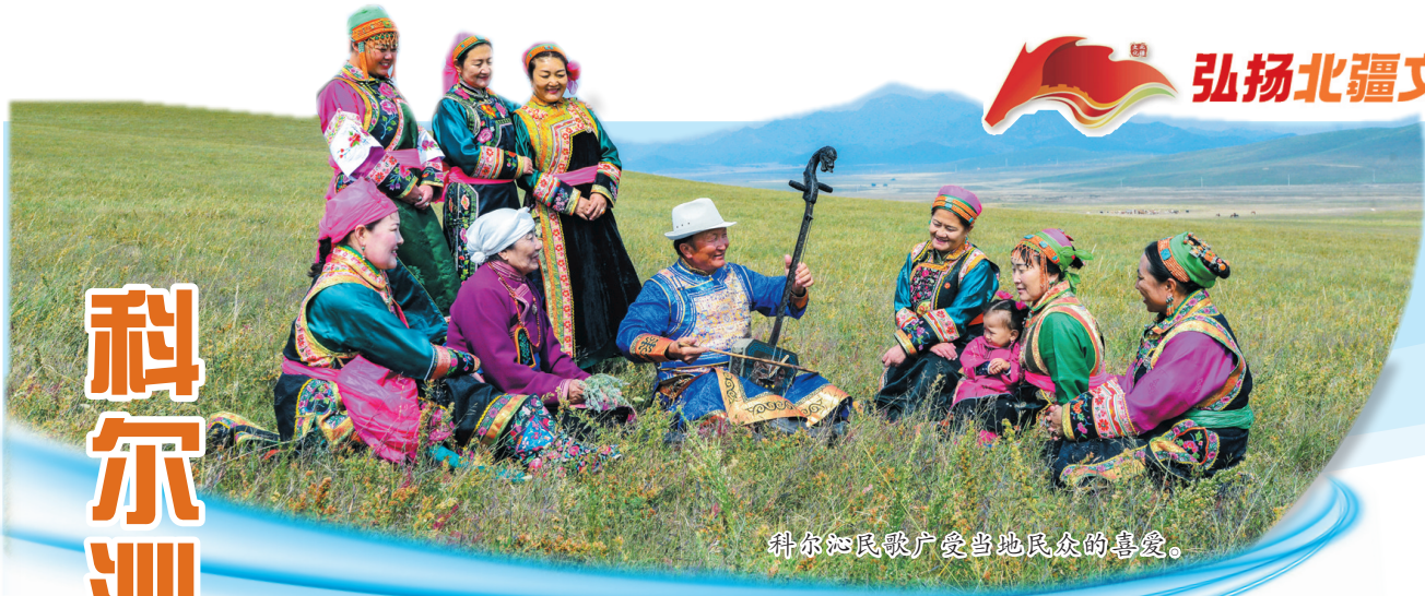
科尔沁民歌广受当地民众的喜爱。

在辽阔的北疆草原上,蜿蜒的西辽河宛如金色绸带,既滋养着“风吹草低见牛羊”的游牧画卷,更孕育出国家级非物质文化遗产——科尔沁民歌。这些旋律悠扬、歌词质朴的民歌,以深厚的情感成为西辽河文化最生动的“声音印记”。侧耳倾听,音符中流淌着河流的絮语,唱词里跃动着草原的脉搏,它们既是通辽“北疆文化”的鲜活载体,更是打开厚重“西辽河文化史记”的第一乐章。