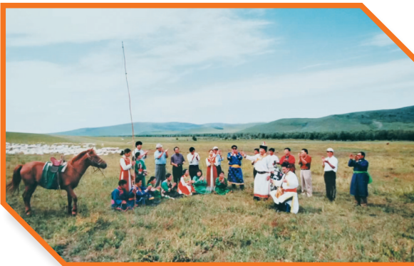
2005年8月,扎鲁特旗军马场牧区响起动人的科尔沁民歌。