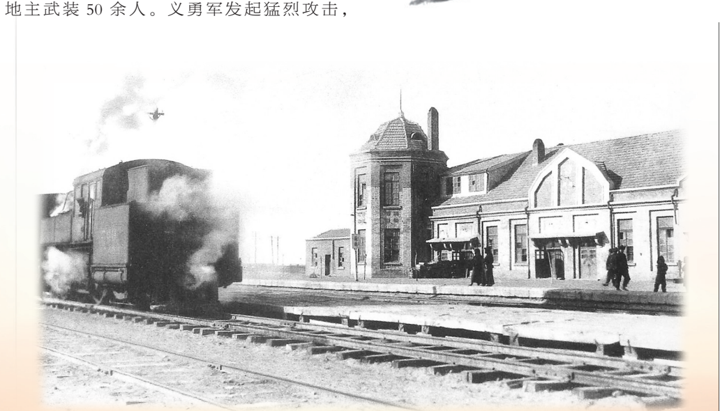
打通铁路通辽车站

金子明部第20路抗日义勇军在打通铁路线上开展的一系列破袭战，如同在敌人的心脏地带点燃了熊熊烈火，有力地破坏了敌人的军事运输，在锦州外围构筑起了一道坚固的防御屏障，成功地阻击了日军对锦州的包围进攻和继续西进。他们用鲜血和生命，在辽西抗战史上写下了浓墨重彩、光辉灿烂的篇章，其英勇事迹具有深远的历史意义和重要的现实意义，将永远铭刻在中华民族的历史长河中，激励着一代又一代中华儿女为了国家的尊严和民族的复兴而不懈奋斗。