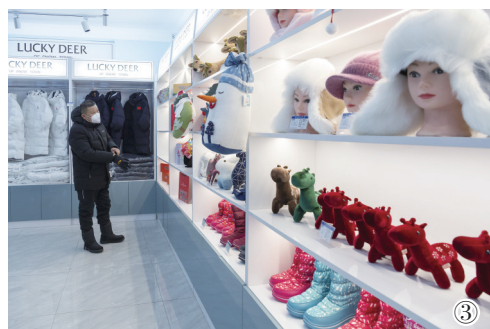
③游客在雪乡景区的一个旅游纪念品商店内选购。