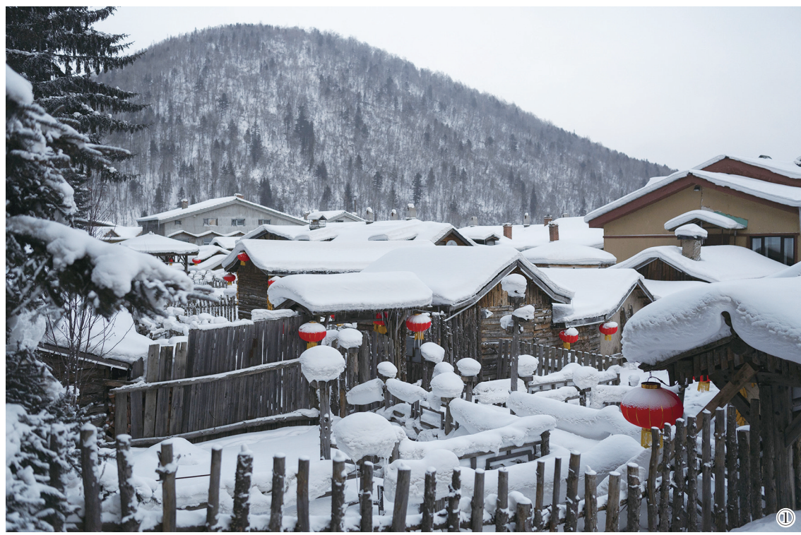
①拍摄的雪乡景区一角。