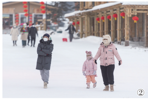
②游客在雪乡景区内游玩。