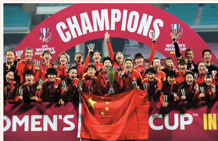
2022女足亚洲杯决赛中,中国队以3:2战胜韩国队,夺得冠军。