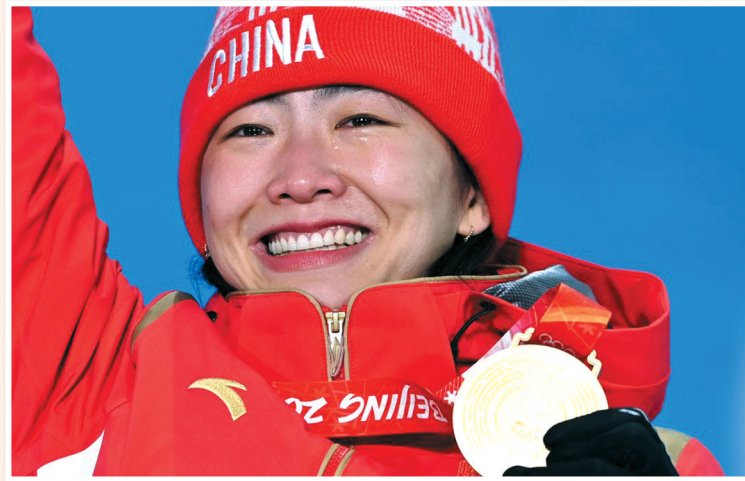
北京2022年冬奥会自由式滑雪女子空中技巧冠军、中国选手徐梦桃在奖牌颁发仪式上。

今年3月,邓小岚在准备音乐节时因脑梗突然离世。舞台之上,天真的孩子们用歌声撑起了一片天;舞台之下,虽再也没有小岚老师充满爱的凝视,但她留给孩子们的,是永远饱含温情和力量的回忆。