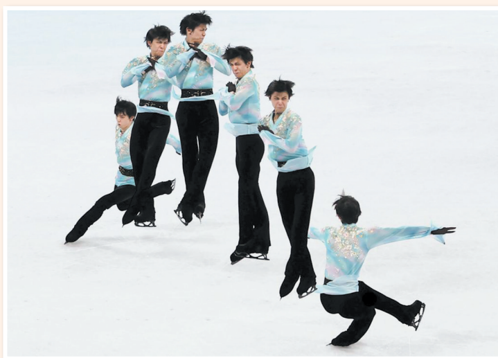
日本选手羽生结弦在比赛中尝试阿克塞尔四周跳(拼接照片)。