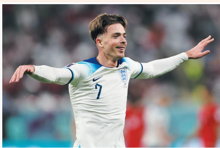
英格兰队球员格拉利什庆祝进球。