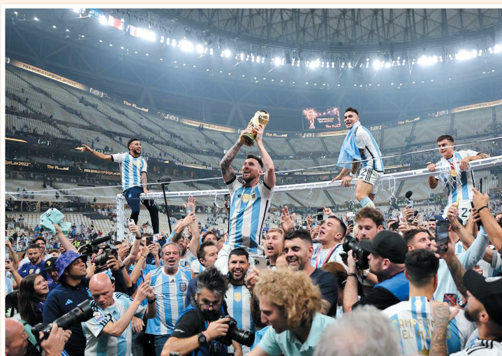
阿根廷队球员梅西(上左二)在比赛后手捧大力神杯庆祝。

在体育的世界,总有一些瞬间能让人情绪翻涌、眼眶湿润,那是一种无关国界、性别、年龄、种族的情感共鸣,可能是感慨于英雄迟暮意难平,也可能是感动于逐梦者不懈奋斗终如愿,再或者是感佩于人们双向奔赴的善意与勇气。