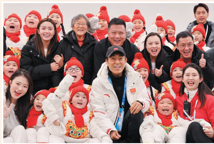
在国家体育场(鸟巢)后台,邓小岚(黑衣左二)、马兰花儿童合唱团与总导演张艺谋(前中)合影。