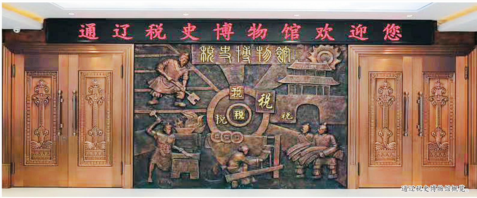
通辽税史博物馆概况。