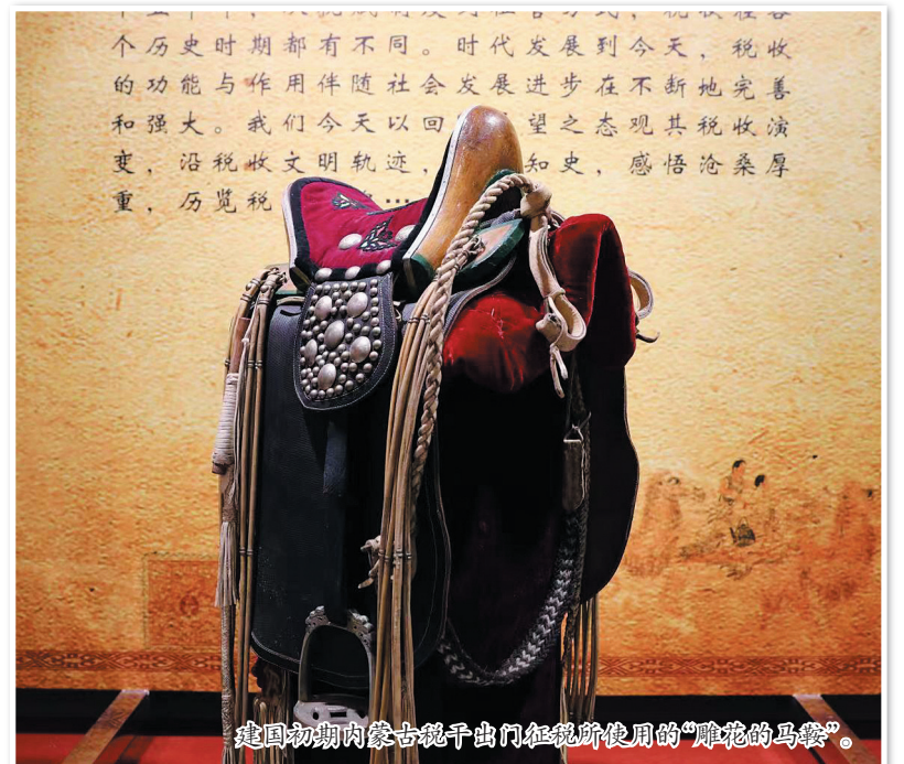
建国初期内蒙古税干出门征税所使用的“雕花的马鞍”。