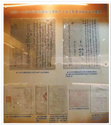
建国初期通辽地区不动产交易相关文书票据。